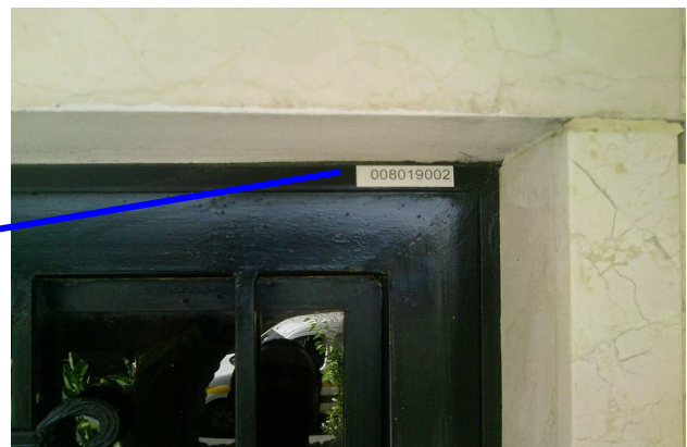
Opération de collage des plaquettes de repérage géographique

Nous vous remercions de votre compréhension et votre collaboration